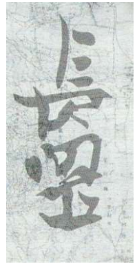
1 「長岡口」墨書土器 向日市鶏冠井出土 飛鳥時代 向日市教育委員会